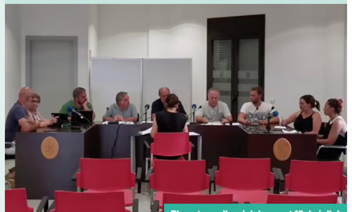
Ple extraordinari del passat 19 de juliol.